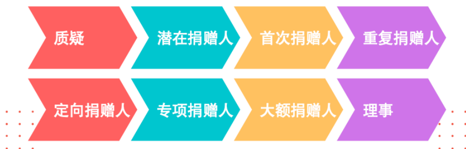
图 5 有梯度的理事筛选路径