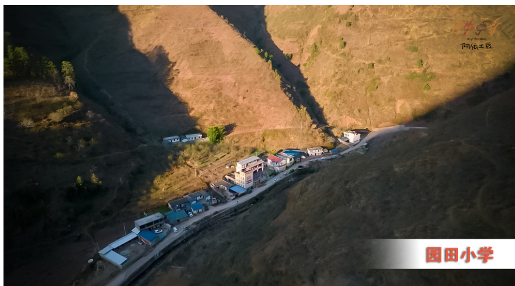
图3 大山里的支教校点

后者主要通过支教主项目下的诸多“子项目”来实现，如旨在保障健康成长的“阿依阿杰鲁-为孩子募集冬衣项目”“大凉山里的爱心餐项目”“温暖的被窝项目”“学生清洁包项目”等；旨在促进快乐成长的“志愿者成长训练营项目”“女童关爱包项目”“主题月兴趣班项目”“小升初英语夏令营项目”“‘豆苗书屋’阅读项目”“支教教师温暖陪伴项目”等等。在学识成长方面，则主要通过教师队伍的筛选培养来实现。