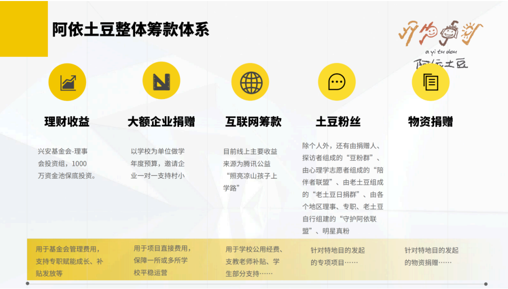
图 4 阿依土豆的筹款体系

图 4 呈现了阿依土豆的整体筹款体系，主要由保底资金池的理财收益、企业大额乃至包校捐赠、互联网筹款、土豆粉丝、个人、物资捐赠 5 个部分组成，1000 万元的理财收益用于基金会管理费用，支持专职人员的成长和补贴发放。在此之外，大额企业捐赠大约占 50%以上，互联网筹款占 25%且比例呈现增长趋势，土豆粉丝、个人、物资捐赠各占 7%左右。